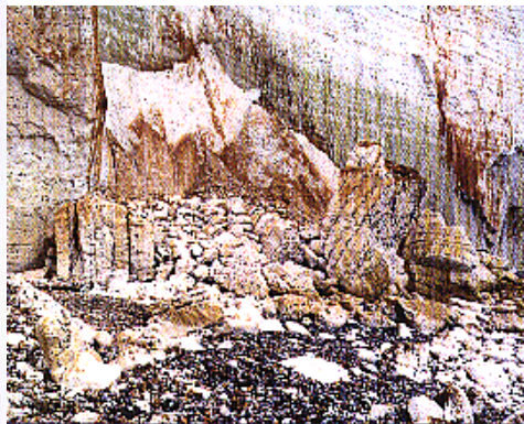
PÔLE IMAGE HAUTE-NORMANDIE

The Rockfalls of Normandy GALERIE PHOTO 15 rue de la Chaire - Rouen 02 35 89 36 96